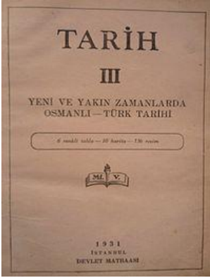
Türk Tarihinin Ana Hatları. (1931-1941-ci illərdə litseylərdə istifadə olunan tarix dərslər kitabı)

Türk tarixində baş vermiş köçlər və türklərin ilkin məskəni araşdırarkən James Churchwardın tədqiqatları Atatürkün diqqətini cəlb etmişdi (The Lost Continent of Mu (1926); Books of the Golden Age (1927); The Children of Mu (1931); The Sacred Symbols of Mu (1933)). Churchward Hindistanda olan zaman Tibetli bir rahiblə tanış olur. Ondan üzərində qədim mədəniyyətlər və dinlər haqqında məlumatlar olan daş kitabələr olduğunu öyrənir və bundan sonra burada qalaraq